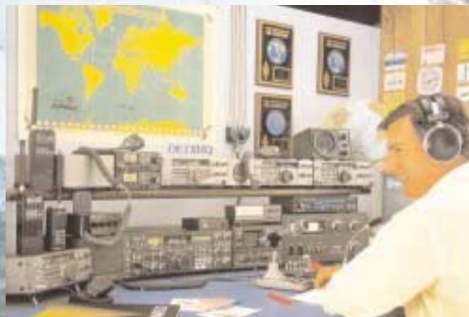
Amateurfunk ist völkerverbindend – eben eine Welt ohne Grenzen.

Um die Amateurfunkbewilligung zu erlangen legt man nach einem Vorbereitungskurs vor der österreichischen Fernmeldebehörde eine Prüfung ab. Die Prüfung kann für verschiedene Bewilligungsklassen, CEPT-Klassen, die nahezu weltweit gelten, oder eine Einsteigerklasse, die in Österreich gilt, beantragt werden.