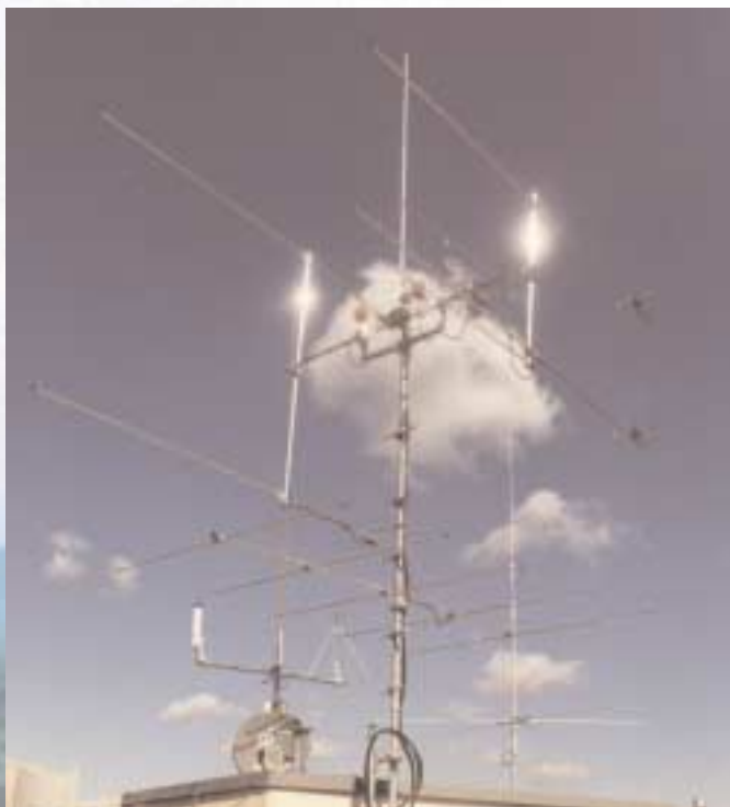
Das ist schon eine recht große Antennenanlage einer Amateurfunkstation. Für den Anfang reicht auch eine einfache, 1–2m lange Stabantenne.

... ist in den meisten Ländern der Welt gesetzlich reglementiert und geschützt.